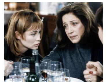
1999 LA BÛCHE de Danièle Thompson avec Emmanuelle Béart