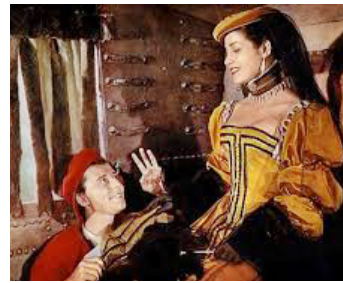
1956 LES AVENTURES DE TILL L'ESPIÈGLE de G. Philipe et Joris Ivens avec Gérard Philippe