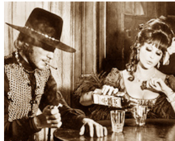
1969 LE SPÉCIALISTE (I Specialisti) de Sergio Corbucci avec Johnny Hallyday