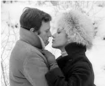
1969 MA NUIT CHEZ MAUD d'Éric Rohmer avec Jean-Louis Trintignant