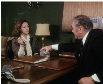
1976 ALLÔ MADAME (Natale in casa d'appuntamento) d'Armando Nannuzzi avec Ernest Borgnine