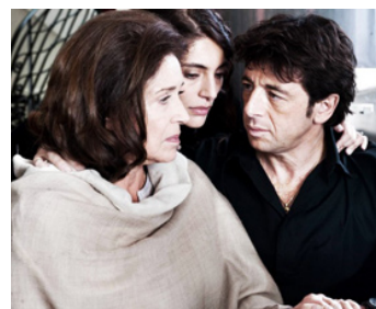
2010 COMME LES CINQ DOIGTS DE LA MAIN d'A. Arcady avec Caterina Murino, Patrick Bruel