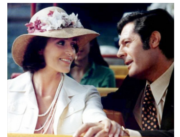
1973 SALUT L'ARTISTE d'Yves Robert avec Marcello Mastroianni