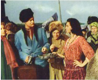
1956 MICHEL STROGOFF de Carmine Gallone avec Curd Jürgens