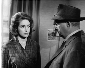
1963 MAIGRET VOIT ROUGE de Gilles Grangier avec Jean Gabin