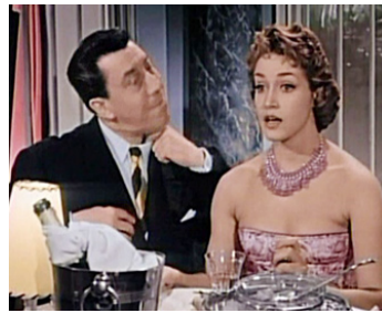
1956 LE COUTURIER DE CES DAMES de Jean Boyer avec Fernandel