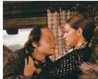
1975 LES FOUGÈRES BLEUES de Françoise Sagan avec Jean-Marc Bory