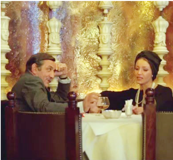
1973 LA BONNE ANNÉE de Claude Lelouch avec Lino Ventura