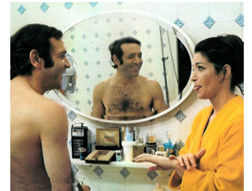
1970 ÊTES-VOUS FIANCÉ À UN MARIN GREC OU À UN PILOTE DE LIGNE ? de G. Pirès avec J. Yanne