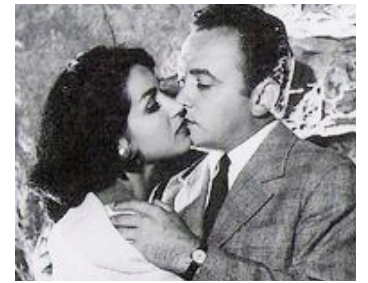
1956 LE FEU AUX POUDRES d'Henri Decoin avec Raymond Pellegrin