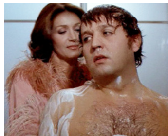
1973 POUR AIMER OPHÉLIE (Per amare Ofelia) de Flavio Mogherini avec Renato Pozzeto