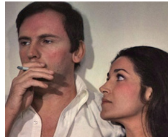
1969 L'AMÉRICAIN de Marcel Bozzuffi avec Jean-Louis Trintignant