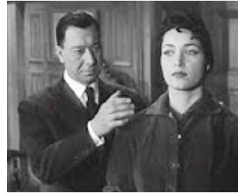
1957 LES VIOLENTS d'Henri Calef avec Paul Meurisse