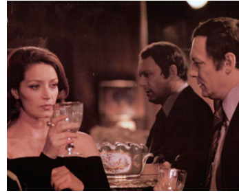
1977 MADAME CLAUDE de Just Jaeckin avec Maurice Ronet