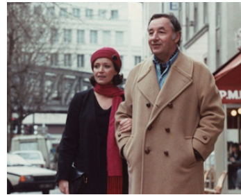
1983 L'AMI DE VINCENT de Pierre Granier-Deferre avec Philippe Noiret