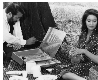
1972 LA VENGEANCE DU SICILIEN (Torino Nera) de Carlo Lizzani avec Bud Spencer