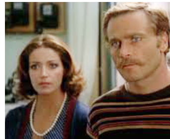
1974 POURQUOI TUER UN MAGISTRAT ? (Perche si uccide un magistrato) de D. Damiani avec F. Nero