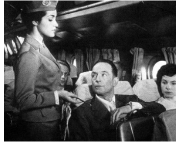
1957 LES FANATIQUES d'Alex Joffé avec Pierre Fresnay