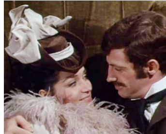
1966 LE VOLEUR de Louis Malle avec Jean-Paul Belmondo