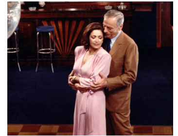
1988 TROIS PLACES POUR LE 26 de Jacques Demy avec Yves Montand