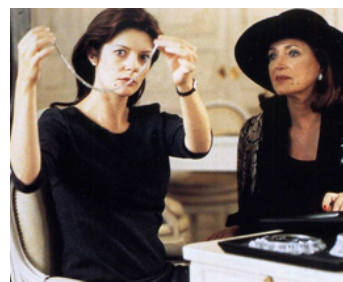
1999 LA LETTRE (A Carta) de Manoel de Oliveira avec Chiara Mastroianni