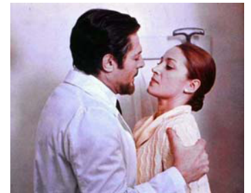
1974 VERTIGES (Per le antiche scale) de Mauro Bolognini avec Marcello Mastroianni