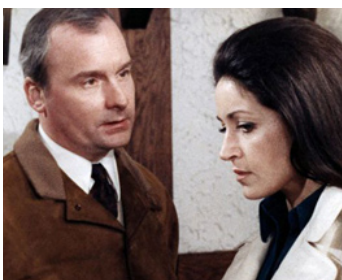
1970 UN CONDÉ d'Yves Boisset avec Michel Bouquet