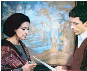
1983 BENVENUTA d'André Delvaux avec Mathieu Carrière